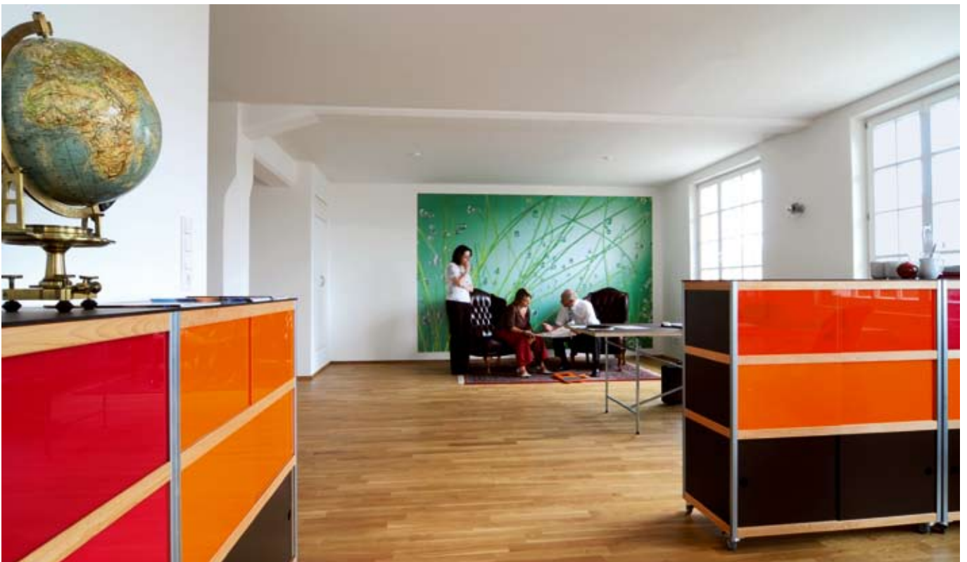
Die bunte Welt des Designbüros „Die Keimzelle“ mit Möbeln von b.wohnbar aus dem Konstanzer Neuwerk.

Gewisse Synergie-Effekte seien da schon vorhanden gewesen. Wenn auch der Leitgedanke zum Arbeiten im Neuwerk „Kein Recht auf Ruhe“ sicherlich nicht uneingeschränkt auf das Hohnerareal übertragbar ist. Nimmt man die Musik einmal aus.