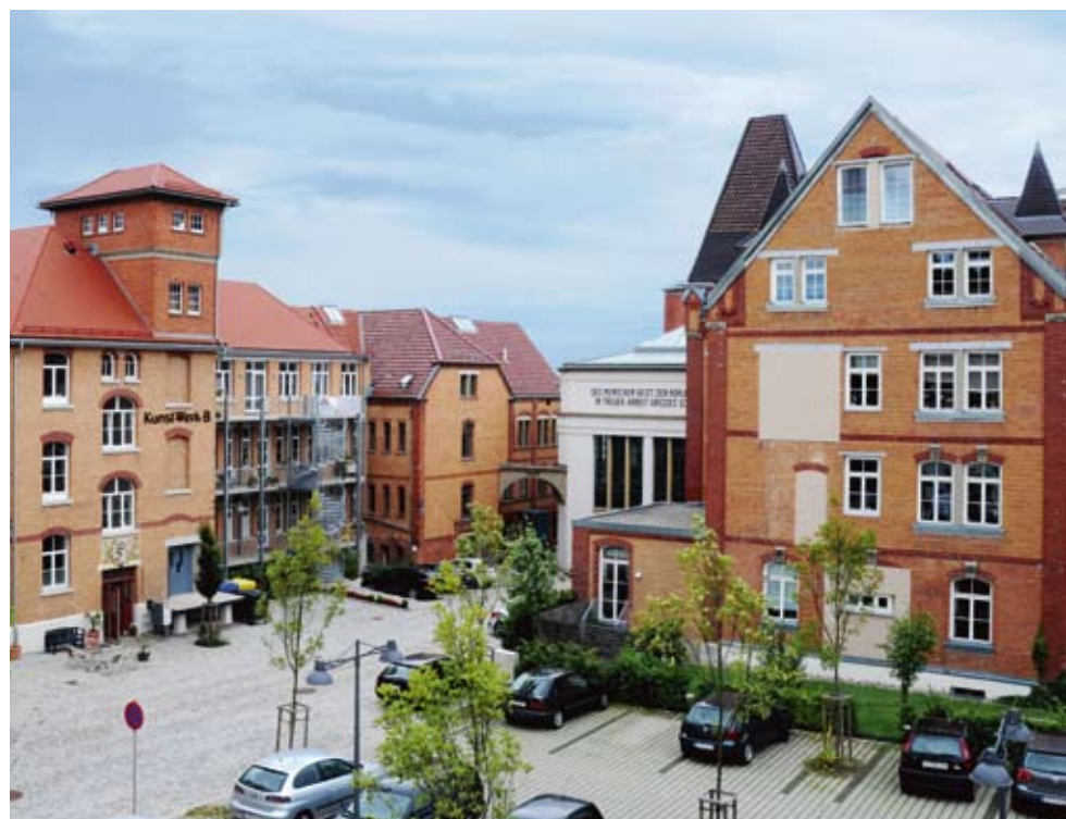
Ein Blick in die Nachbarschaft zeigt, wie das Werksgelände Stück für Stück gewachsen ist. Oben links die ehemalige Hohner-Villa, rechts die schmucken Ornamente am Bau V.