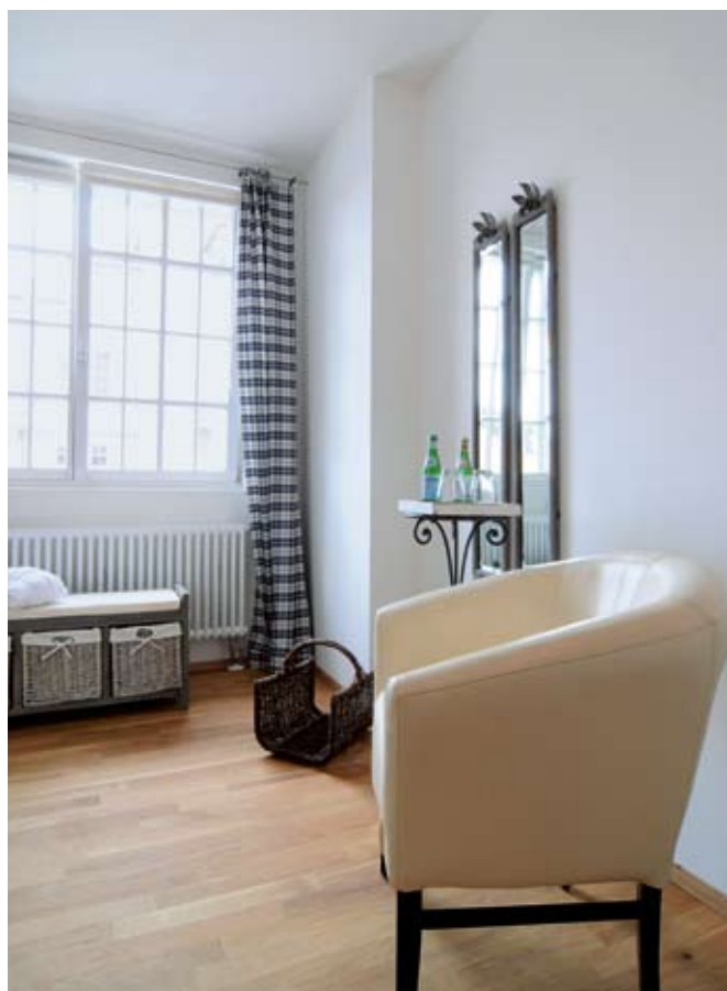
Das neue Hotel Benvenuto im Hohnerareal Bau V zeigt sich Zimmer für Zimmer von einer anderen Seite.

Beim Anblick der scheinbar endlosen Werkhallen im Bau V war viel Fantasie gefragt, künftigen Nutzern einen auch nur kleinen Eindruck der vielfältigen Möglichkeiten zu geben. So wurde in einer Etage ein kleines Abteil renoviert und für die Kundenberatung eingerichtet. Der Durchbruch gelang schon kurz nach Start der Vermarktungs-Aktionen, als die